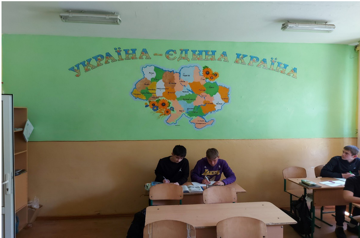
Peretschny, Orsteil Simer, Unterricht in der 9. Klasse „Ukraine – einziges Land“