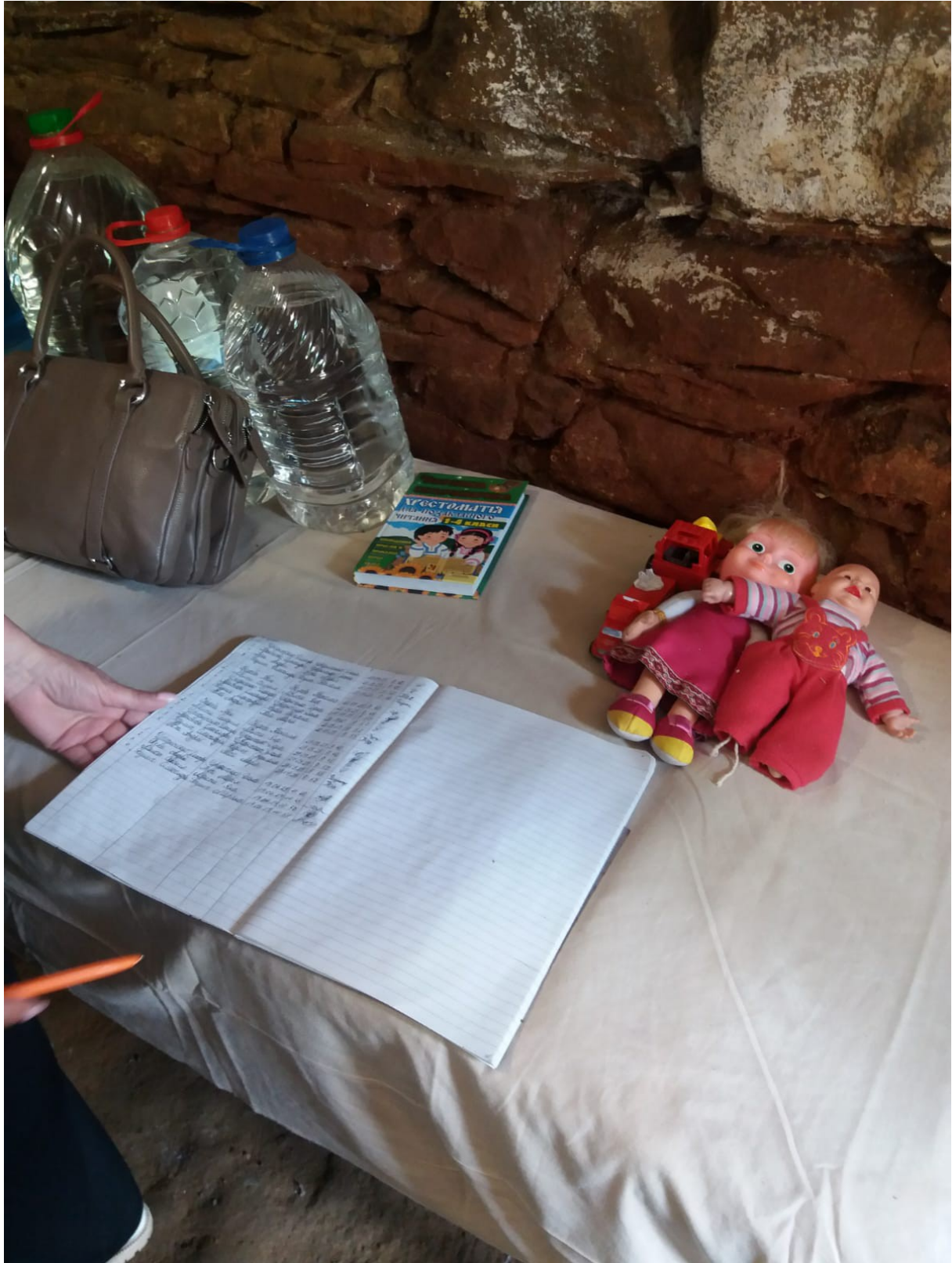
Peretschyn, Ortsteil Simerki, Schutzraum Kindergarten mit Berichtsbuch