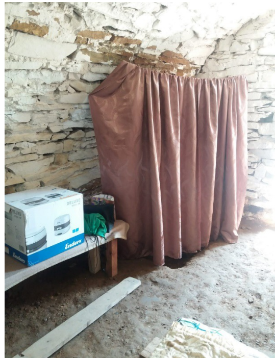
Einer von drei Schutzräumen der Schule im Ortsteil Simerki

Und doch: die kleine Landschule im abgelegenen Ortsteil Simerki, die nur über eine holprige Nebenstraße zu erreichen ist, macht auf die Besucher einen überaus intakten und lebensfrohen Eindruck. Die Leiterin verweist stolz auf die Erfolge der Absolventen, die zu einem großen Teil nach Abschluss der 9. Klasse weiterführende Fachschulen besuchen oder ein Studium anstreben.