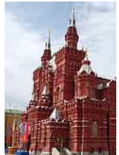
Historisches Museum (1872) und die Fassade des GUM (1893) am Roten Platz sind zwei wichtige Vertreter des russischen Historismus