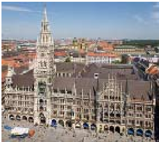
München, Marienplatz, Neues Rathaus im Neugotischen Stil, erbaut 1867-74

Es sind zentrale Bauwerke in den Hauptstädten München und Moskau, die in der zweiten Hälfte des 19. Jhd. in historisierenden Stilen entstanden, und der nationalen