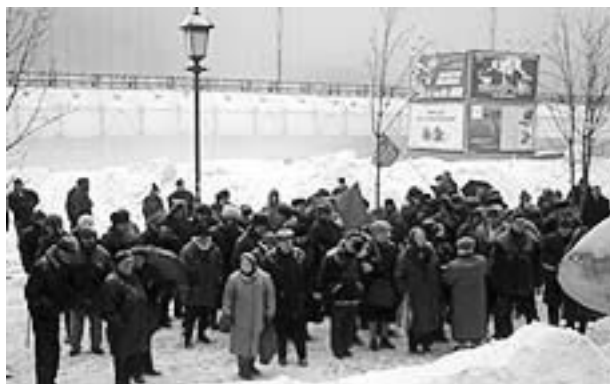
Demonstranten vor dem Leninmuseum

Neue Orgel für katholische Gemeinde in Moskau. Die besten Orgelspieler Europas trafen sich Anfang Februar zum Festival „Musik der Kathedralen der Welt“ anlässlich der Einweihung der neuen Orgel in der Mariä Empfängnis Kathedrale in Moskau. Die Orgel war 1955 für das Baseler Münster gebaut worden und wurde nun der Moskauer katholischen Gemeinde geschenkt.