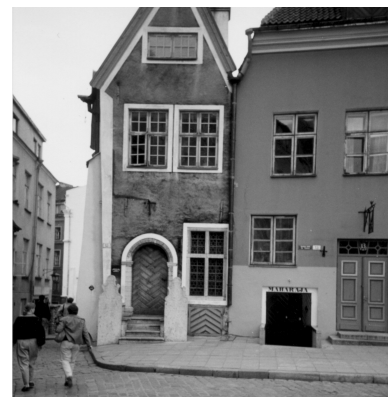
In Tallinn gibt es schöne alte Häuser

Ralph-Jürgen Schoenheinz Galina Kirsunova